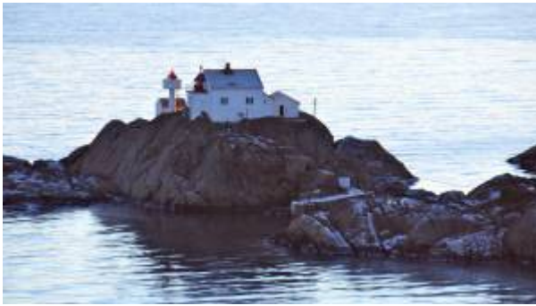
Vibberodden 2012.