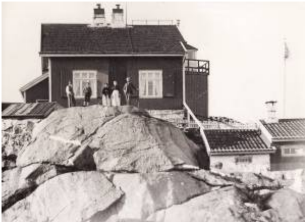
Vibberodden fyrstasjon. Den lodrette stripa midt på huset er rødmalt. Slik merking ble brukt for å skille fyrbygninger fra annen bygningsmasse langs kysten og for å forsterke fyret som dagmerke.

Vibberodden fyr er et innseilingsfyr som skulle lede fartøyer fra åpen sjø til det sydlige innløp til Egersund og videre til Gjellestadvika hvor det var god ankringsplass.