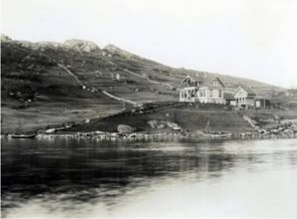
Fagerheim inderst i Eiebukte.