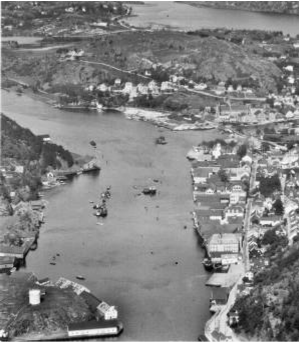
Vågen og Bukte i 1930-åra.

Vågen er egentlig den del av Egersund havn som ligger mellom Lindøygapet og ei linje mellom Lundeånas utløp og Rauhedlå. Innenfor denne linja het det Bukte – "Inne på Bukte, ute på Vågen". Bukte er det stykke av sjøen hvor isen legger seg først. På Eie-siden het det Eiebukte og på den andre siden Hafsøybukte.