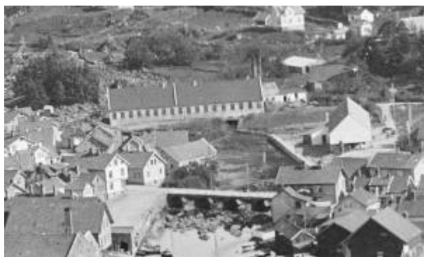
Ullvaren ca 1920. Foto: T. Sandstøl/DF (Utsnitt)

I 1903 tok Molvær over virksomheten og drev den videre som Egersunds nye Uldvarefabrik . Stadig hardere konkurranse gjorde at fabrikken måtte redusere driften betraktelig etter som tiden gikk, og i 1911 ble både mølla og fabrikken solgt på tvangsauksjon for 29 000 kr.