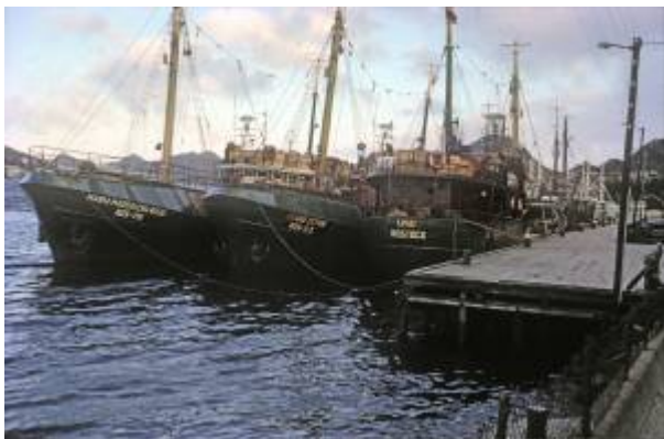
Trålere fra Rostock ved Tyskerbrygga i 1965.

Fortøyningsbrygga som ligger i forlengelsen av Dampskipskaien langs Varbergveien kalles Tyskerbrygga . Navnet fikk den siden øst-tyske fiskere som deltok i sildefisket i Nordsjøen var de første til å ta den i bruk da den sto ferdig i 1961.