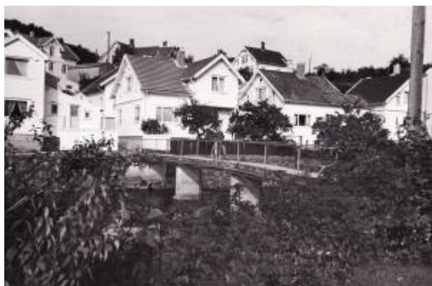
Tyskerbrua 1970.

Tyskerbrua ble, som navnet antyder, bygget av tyskerne under okkupasjonen, antakelig tidlig i 1941. Den krysser Lundeåne ca 150 meter oppstrøms Damsgårdsbrua .