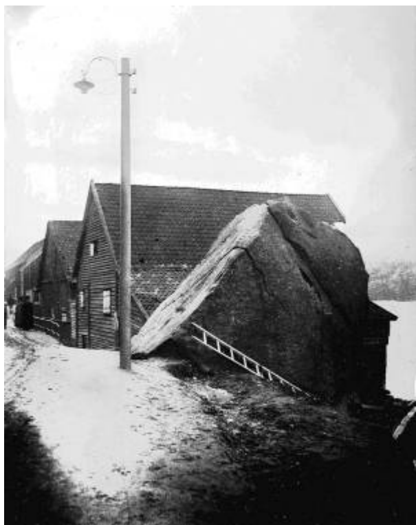
Torskjeldå lå like ved Torssteinen.

Rett nedenfor dagens Strandgaten 13 og 15, like ovenfor vannkanten, var det en kilde som het Torskjeldå. I denne kilden kunne både byens befolkning og fartøyer som var innom havna hente godt drikkevann. 1)