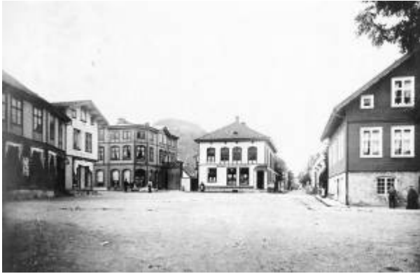
Torget i 1890-åra.

Plassen i krysset mellom Johan Feyers gate og Strandgaten , navnsatt i 1905.