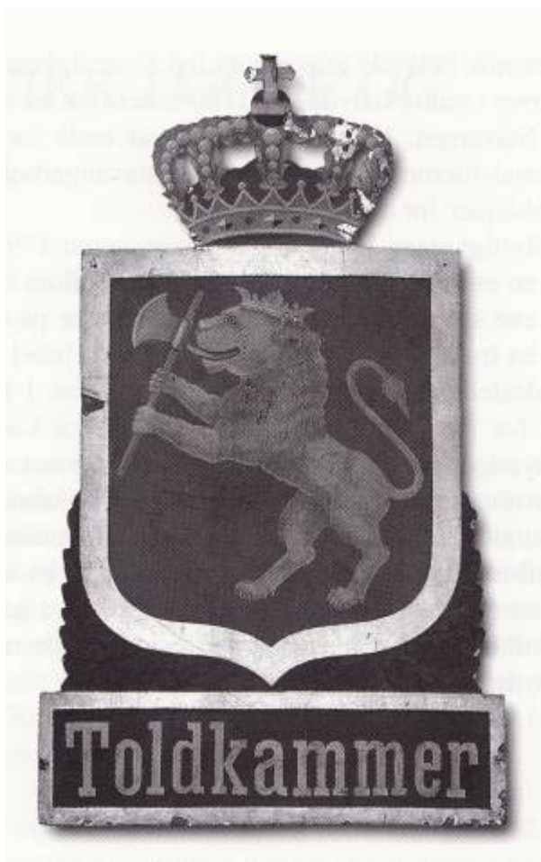
Egersund toldkammers skilt.