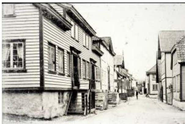
Thorsenhuset i forgrunnen på venstre side.

Strandgaten nr. 43. Bygningen er en av tre Freda bygninger i Egersund, fredet etter lov av 02.12.1920 og tinglyst 24.08.1923.