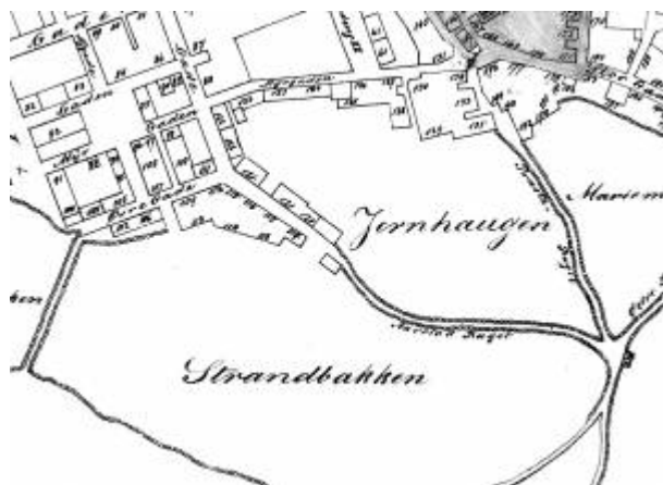
Utsnitt av Bykart 1868.

Betegnelsen på deler av området ovenfor bebyggelsen langs Egersundstronne , mellom Malmbakken og Jernhaugen . 1)