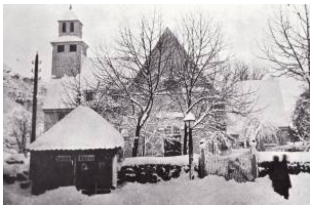
Sprøytehus nr. 2 ved kirka.

Et sprøytehus er et hus til å oppbevare brannutstyr, som bøtter og brannsprøyter, derav navnet.