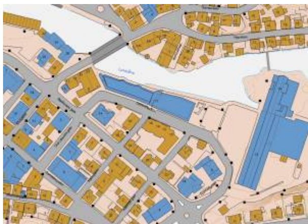
Kart: Eigersund kommunes kartløsning.

Opprinnelig ei sidegate ut fra Mosbekk plass , i retning Lundeåne , regulert i Reguleringsplan 1858 og navnsatt i 1905. Nå er den forlenget langs Lundeåne fram til Bøckmans gate .