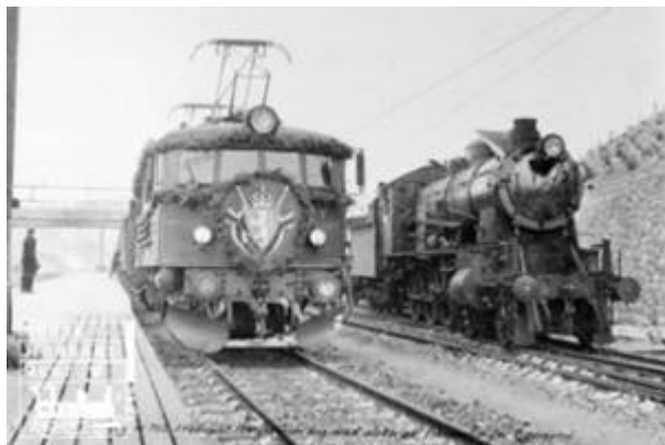
Egersund stasjon med åpningstog for elektrisk drift på Sørlandsbanen i 1950, tog 702 trukket av elektrisk lokomotiv type EI 8 nr. 2065 ved siden av damplokomotiv type 30b.

Sørlandsbanen er navnet på jernbanen mellom Stavanger og Oslo. Egersund er fast stasjon på banen, 525 km fra Oslo og 73 km fra Stavanger. Med Sørlandsbanen ble Egersund og distriktet knyttet til landets øvrige jernbanenett, og reisetiden til Oslo ble redusert dramatisk i forhold til situasjonen før banens fullførelse.