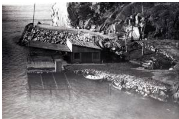
Solkrone, 1955.

Solkrone (Statens Kartverk: Solkroa ) er området ved foten av Varbergs sørside, der Varbergveien dreier skarpt mot øst, sør for Tyskerbrygga . Fram til siste utvidelse av Varbergveien på denne strekningen var det en benk mellom vegen og fjellet der en kunne sitte i ly for nordavinden, med sola skinnende fra sør, og betrakte trafikken i Sørå Sundet.