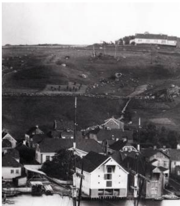
Soldaterhaugen til venstre i bildet, litt over midten. (Utsnitt)

Soldaterhaugen var betegnelsen på en haug som lå på øvre siden av Hammers gate , mellom denne og Kjeld Bugges gate og sørøst for krysset med Husabøveien, der mannskapene på Lindøy batteri etter tradisjonen drev våpenøvelser. 1)