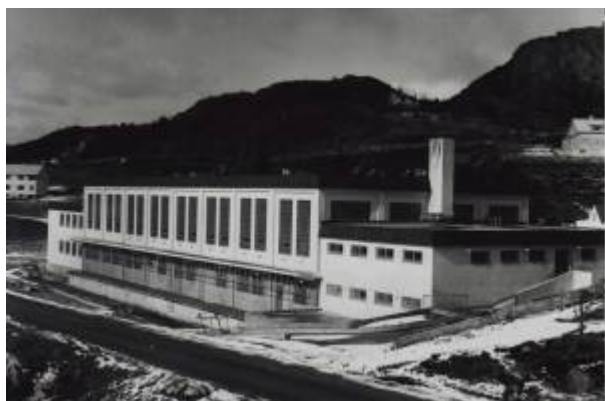
Det nye slakthuset på Eie sto ferdig i desember 1954.

Allerede i 1940 hadde Rogaland Fellesslakteri kjøpt en tomt på Eie med tanke på å etablere et moderne slakteri der. Det kommunale slakthuset i byen var lite og umoderne, og sauebøndene ønsket seg sterkt et nytt slakteri.