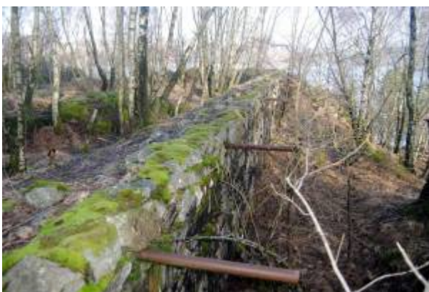
Anvisergrava på 300-meteren.

Den nye banen inspirerte til stor aktivitet i laget, og det kulminerte med arrangement av det 24. landsskytterstevne i juni 1916 med 288 deltakere. Deretter avtok aktiviteten, og i årene 1928 - 1934 var det nesten ikke aktivitet.