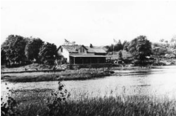
Skytterhuset ved Nyeveien, 1947.

Egersund skytterlags bane i Hestholan måtte rundt 1900 vike for Flekkefjordbanen , og i 1900 fikk laget bygd en ny bane ved Nyeveien , ved Lundeånas utløp fra Slettebøvatnet. Det ble en tidsmessig og svært moderne skytebane med skytterhus og hold på 100, 200, 300, 400, 600 og 800 meter. Samtlige av anvisergravene på disse holdene er fortsatt godt synlige i terrenget.