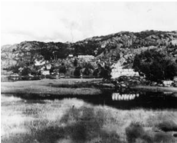
Skyteskiver på 100 og 300 meters hold. 1948.

Egersund skytterlags bane i Hestholan måtte rundt 1900 vike for Flekkefjordbanen , og i 1900 fikk laget bygd en ny bane ved Nyeveien , ved Lundeånas utløp fra Slettebøvatnet. Det ble en tidsmessig og svært moderne skytebane med skytterhus og hold på 100, 200, 300, 400, 600 og 800 meter. Samtlige av anvisergravene på disse holdene er fortsatt godt synlige i terrenget.