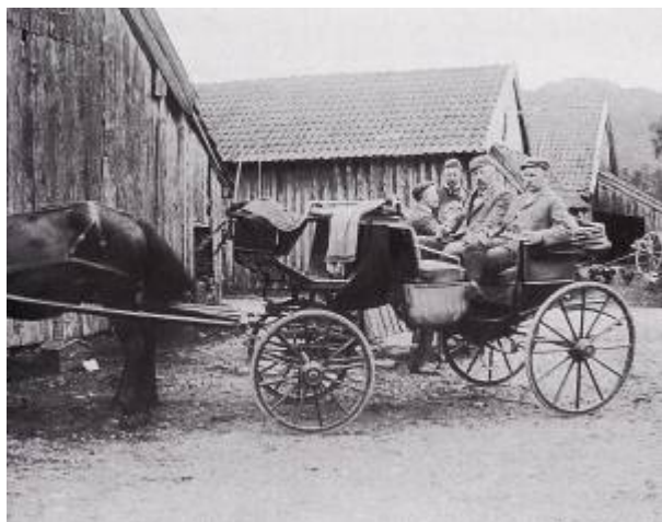
Børrild Birkelands trille i Bjerkreim 1907.

Navnet "Skysskafferstykket" tyder på at den eldste skysstasjonen ved Egersund lå på Høgevollen på Hafsøya , ved den gamle hovedvegen ut av byen. Stasjonen var en tilsigelsesstasjon. 2) Omkring 1870 hadde stasjonen blitt flyttet til byen, men var fortsatt en tilsigelsesstasjon.