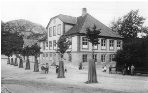
Skrivergården i 1890-åra.

Strandgaten 58, Skrivergården, er en av tre Freda bygninger i Egersund, fredet etter lov av 02.12.1920 og tinglyst 24.08.1923.