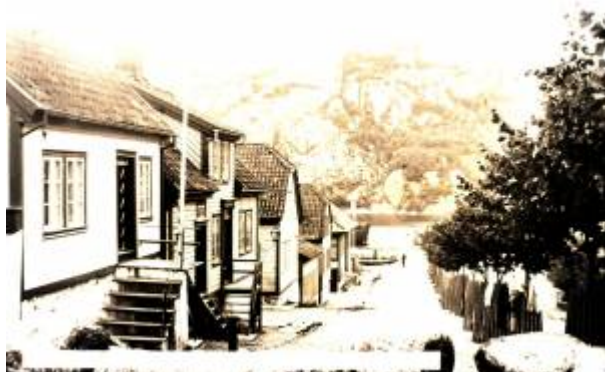
Skriveralmeningen i 1890-åra.

Gate mellom Vågen (Skriversbrygga) og Hammers gate , navnsatt i 1905.