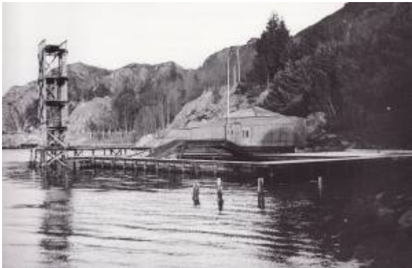
Sjøbadet ved Fjellparken.