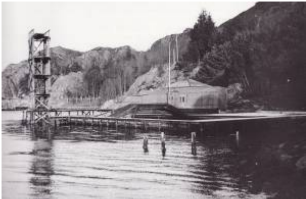
Sjøbadet ved Fjellparken.