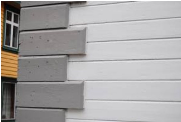
Falske hjørnesteiner, rustika, på Hammergården . Foto: Per Einar Lædre

Den første bygningen i egersundsområdet som ble oppført i empire/senempire var Consul Kroghs lysthus fra 1830-åra på Slettebø, mens Christian Feyers to bygninger på Slettebø (som nå er en del av Dalane Folkemuseums anlegg) var de siste. Disse sto ferdig i 1860-årene.