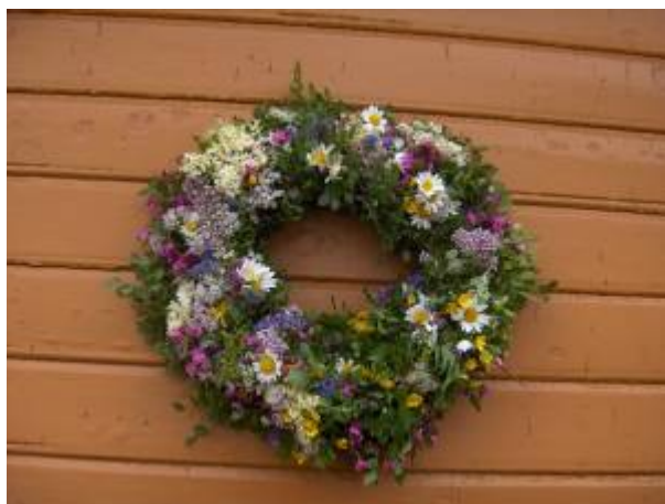
Sankthans-krans, bundet av Reidun Lædre.

Langs kysten, mellom Egersund og Sør-Trøndelag, er det gammel tradisjon å binde Sankthans-kranser som henges opp på ytterdør eller husvegg. Kransene bindes av markblomster, som på denne tiden av året er på sitt mest kraftfulle.