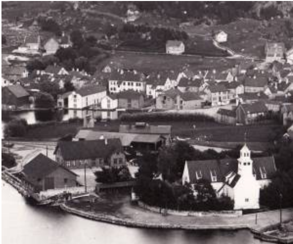
Sandbakken i bakkant, midt i bildet (Utsnitt, 1893).