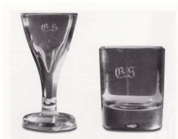
Drikkeglass fra Samlaget.

I 1871 vedtok Stortinget en lov som ga bystyrene muligheten til å gi retten til salg av brennevin til samlag. Tanken var å få offentlig kontroll over alkoholomsetningen. For at aksjonærene ikke skulle ha noe vinningsmotiv skulle de bare ha avkastning av innskutt kapital, og eventuelt overskudd av virksomheten skulle gå til allmennyttige formål.