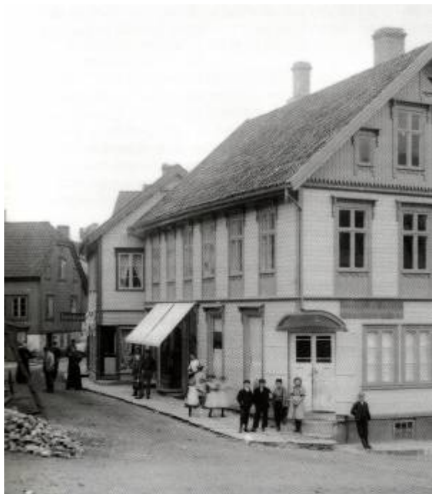
Samlaget hadde butikk i Storgaten 42.

Videre var det utsalg og skjenkested i Storgaten 42 til 1905. Da ble virksomheten flyttet til Hammergården , der Samlaget fikk disponere hele underetasjen fram til 1914.