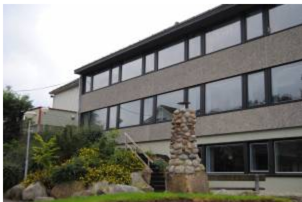
Samfundets skole i Årstaddalen.

I februar 1890 hadde Torkild Valand, som ble den første forstander i menigheten Samfundet , startet en privat barneskole i Egersund. Denne ble overtatt av Samfundet da menigheten var stiftet.