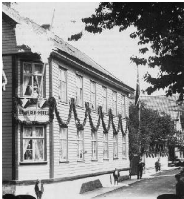
Salvesens Hotel.

Salvesens Hotel lå i Strandgaten 64, i en bygning som ble oppført i 1844, i etterkant av Bybrannen i 1843 . Georgine Salvesen fikk skjøte på eiendommen i 1855 og åpnet hoteldrift i huset.