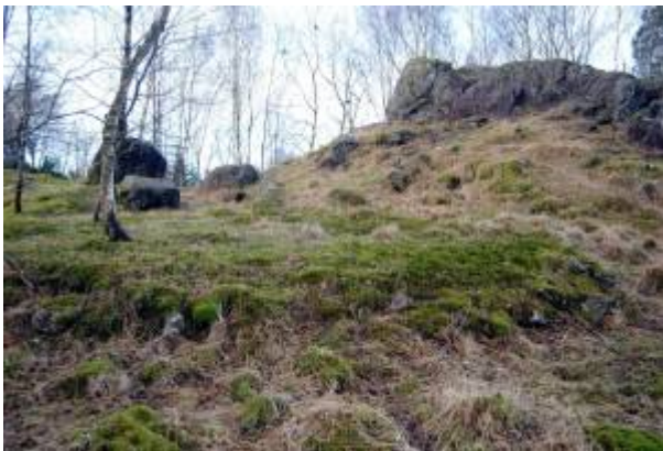
Bålplassen for rygla i Hobdalen, en rund flate med diameter 6 - 8 meter, er fortsatt godt synlig i terrenget.

Hver forsommer var det vanlig å bygge rygler, eller St. Hans bål, på toppene rundt byen: på Litla Varberg, Langaardsfjellet , Kråkefjellet , Årstadfjellet, Skrivarsfjellet og Hobdalen.