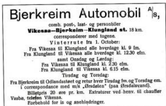
Annonse for ruta Vikeså - Bjerkreim - Klungland. Dalane Tidende 1920

Etter som den biltekniske utviklingen skjøt fart og det overordnede vegnettet begynte å komme på plass lå forholdene godt til rette for en ny form for samferdsel: rutebiltrafikk. Dette førte til økt samhandling mellom by og land. Bøndene kunne sende en stadig større del av sin produksjon til markedet i byen, mens byene på sin side lettere enn før kunne levere varer og tjenester til befolkningen på bygdene. Rutene som ble startet i Dalane illustrer dette. De ble alle etablert i distriktet for å tilby frakt av personer og gods til byen – og til toget. Selskapene var nemlig svært nøye med å opplyse om at "rutene korresponderer med togene". Rutene hadde holdeplasser spredt rundt i byen før det ble etablert en felles rutebilsentral ved Jernbanestasjonen i sentrum kort tid etter frigjøringen.