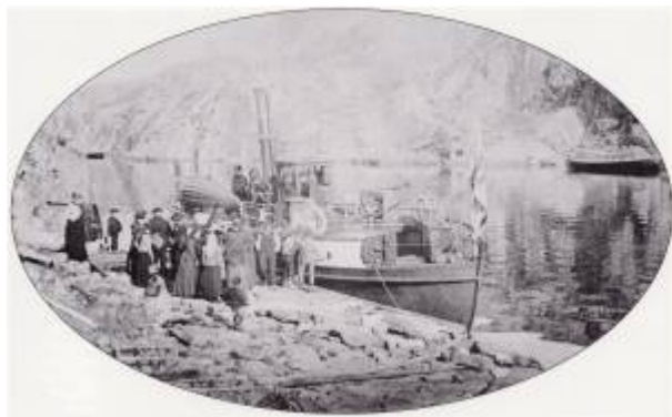
DS «Trafik» i Juvåg (Mong) en søndag i 1902.

For kystbefolkningen var det sjøen som var hovedferdselsåra. For regionale reiser var Kystruta et stabilt alternativ fra midten av 1850-åra, mens den lokale trafikken til og fra Egersund fortsatt ble ordnet privat.