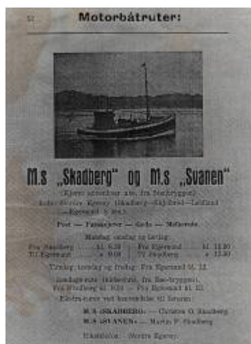
Rutetider for Skadbergskøyta i 1930-åra

Det første tegn til lokalbåttrafikk til Egersund kommer når det blir opprettet poståpneri på Skadberg i 1894. Poståpneren der måtte da hente post fast tre dager i uken i byen, og andre som hadde ærender der benyttet ofte sjansen til å bli med "postruta". Men noen ordinær rutetrafikk var det ikke tale om.