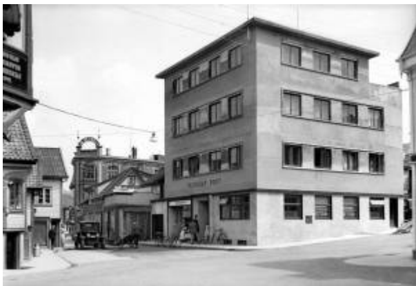
Roberggården på slutten av 1930-tallet.

Storgaten 17, oppført av Kaptein Roberg etter tegninger av arkitekt Gustav W. Helland fra Stavanger. Bygget er oppført i tråd med Reguleringsplan 1931 og i pakt med 1930-årenes arkitektoniske ideal, funksjonalismen. Gården er et klart eksempel på hvordan byen var tenkt å se ut i framtiden.