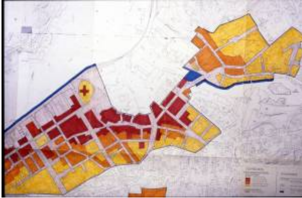
Reguleringsplan 1975.

I mars 1974 tok bygningsrådet opp spørsmålet om å få utarbeidet en ny reguleringsplan for Egersund sentrum. Framdeles var det Reguleringsplan 1931 som gjaldt der det ikke hadde blitt foretatt reguleringsendringer opp gjennom årene. Det var også mange konflikter mellom byens myndigheter og den enkelte byggherres ønske om utnytting av sin eiendom både når det gjaldt riving og nybygging.