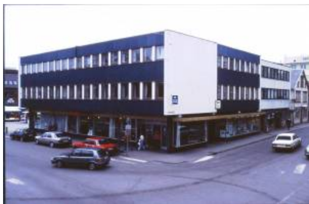
Torvgården i 1991.

Plutselig dukket det opp et nytt forslag, utarbeidet på vegne av noen av grunneierne av arkitekt S. Brandsberg-Dahl i Stavanger. Dette forslaget la opp til at bebyggelsen mot Torget skulle gjøres bredere enn de gamle eiendomsgrensene og gateløpene tilsa, og innebar makeskifte mellom kommunen og grunneiere av gateareal til Kirkegaten . Forslaget innebar at kvartalet kunne bli utbygd helt rektangulært, 50×25 meter, uten forstyrrende skjeve vinkler eller usymmetriske linjer.