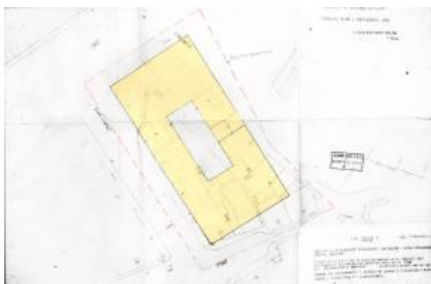
Reguleringsplan 1962.

Han tok utgangspunkt i Reguleringsplan 1931 når det gjaldt gatene rundt kvartalet, mens bebyggelsen han foreslo var av en type som var regulert i flere andre kvartalsplaner i sentrum. Kvartalene var tenkt utbygd med 3-etasjes betongbygg med flatt tak. Høydebegrensningen på 3 etasjer var satt av hensyn til byens øvrige bebyggelse som sjelden var høyere enn det – det var den tids tanker om tilpasningsarkitektur. I midten av kvartalet var det gårdsplass. Dette var ikke helt lett å få til da kvartalet var smalt og gatene ikke var parallelle.