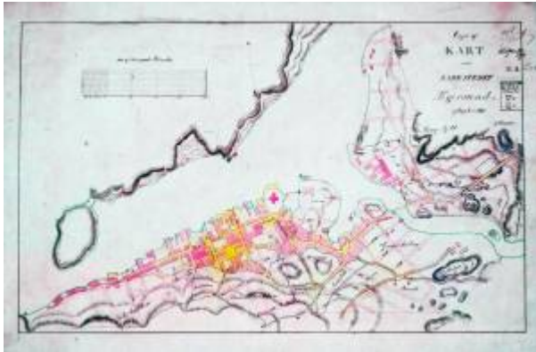
Reguleringsplan 1858.

Til Reguleringsplan 1858 foreligger det også en fyldig beskrivelse. 1)