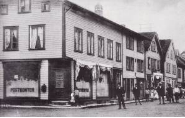
Postkontoret holdt til i Johan Feyers gate 2 i 1905-1910.

I 1890 ble Egersund postekspedisjon oppgradert til postkontor og postekspeditøren fikk tittel av postmester. Noen år senere ble poståpneriene sør for Egersund lagt under Egersund postkontor (de hadde før det ligget under Stavanger), og i 1914 hadde postkontoret 15 underliggende poståpnerier, 8 brevhus og 5 landpostbud og postbefordrere.