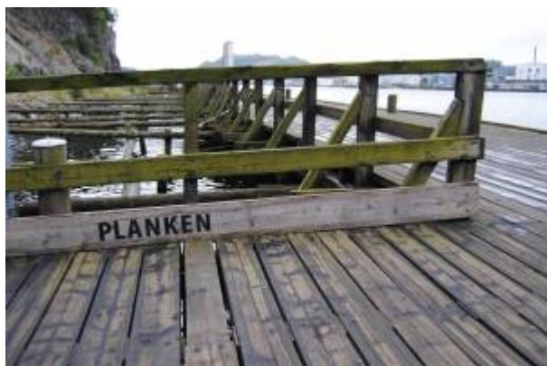
Planken fra 2012.

Sør på Dampskipskaien var det lagt opp en planke som fungerte som en mellomting mellom et rekkverk og en anordning for å hindre kjøretøy å trille på sjøen. En vanlig søndagstur for ladestedets befolkning var å spasere ut Strandgaten , gjerne i samband med Kystrutas anløp, og helt ut til kaikanten og der sette foten på planken og snu. Det kaltes "å trø planken".