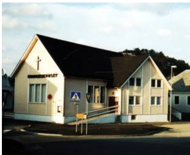
Evangeliehuset, Bøckmans gate 24.

Pinsebevegelsen ble populær blant noen metodister i Egersund i tiden før første verdenskrig brøt ut. De fikk sterk draging mot tilreisende predikanter og tungetalende forsamlinger, og flokken ble smått om senn større. I 1936, da de organiserte seg som dissentermenighet, talte den 40 medlemmer.