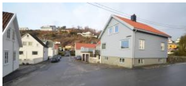
Kirkegårdsmuren sees t.h..

Kirkegård henspeler på den gamle Gravplassen ved Gamlevei som ligger like nord for gata. At den kalles Øvre henger sammen med at det på Reguleringsplan 1905 var regulert ei gate mellom Gamlevei og Langaards gate (omtrent i forlengelsen av Øvre Kirkegårdsgate) som ble gitt navnet Nedre Kirkegaardsgaden. Denne ble aldri bygd, og falt ved en senere regulering bort. 1)