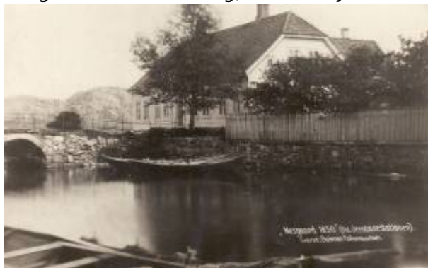
Nesgård mellom 1854 og 1878. Kirkeviken i forgrunnen. I fotoet står teksten «Nesgaard 1850», men dette må være tatt etter 1854 da det er den ombyggede Nesgård vi ser i fotoet.