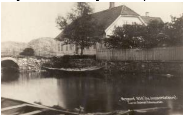
Nesgård mellom 1854 og 1878. Kirkeviken i forgrunnen. I fotoet står teksten «Nesgaard 1850», men dette må være tatt etter 1854 da det er den ombyggede Nesgård vi ser i fotoet.

Opprinnelig betegnelse var Næsgaard. Sorenskriver Niels Paulsen bygde gården på Arenes i 1736. Den lå dominerende plassert øst for kirken , med hovedhusets 28 meter lange fasade vendt mot strandstedet og Kirkeviken . Husets areal var på hele 377 kvadratmeter. Huset hadde valmet tak, og midt på fasaden var det en ark med spiss gavl som elegant brøt de store takflatene. Ei steinhvelvbru over Kirkeviken førte fra eiendommens hage til kirken og strandstedets sentrum.