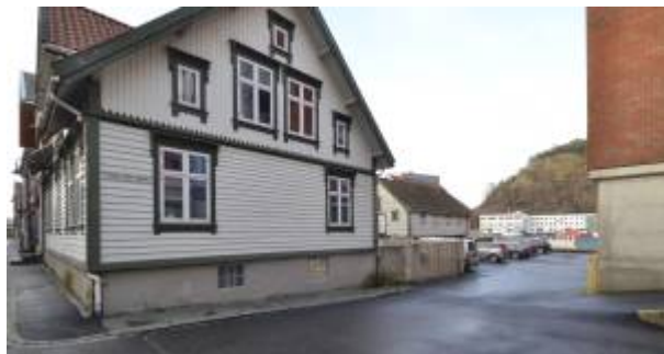
Sett fra Strandgaten.

Gata ble regulert i planen som ble laget etter bybrannen i 1843 , og ble da benevnt som Nedre Bækkegade. Navnet henspiller på at det før gikk en åpen bekk som kom fra området ved Prestegården. Bekken er forlengst lagt i rør under gata. 1)