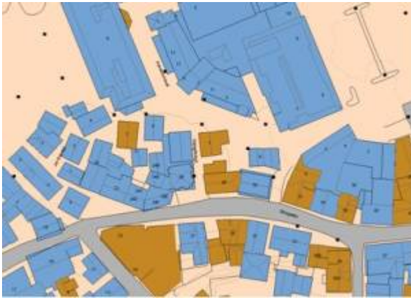
Kart: Eigersund kommunes kartløsning

Sidegate til Storgaten , mellom nr. 26 og 28, navnsatt i 1905. Den har navn etter Nesgård , som lå på Arenes .