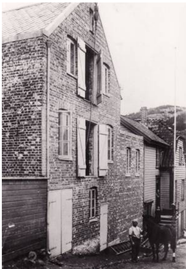
Parti fra Mortens gate, 1939.

Gate mellom Ludvig Feylings gate og Peder Clausens gate , regulert i Reguleringsplan 1858 og navnsatt i 1905. Reguleringskommisjonens forslag til navn var Bakkegaden , men ble endret av formannskapet.