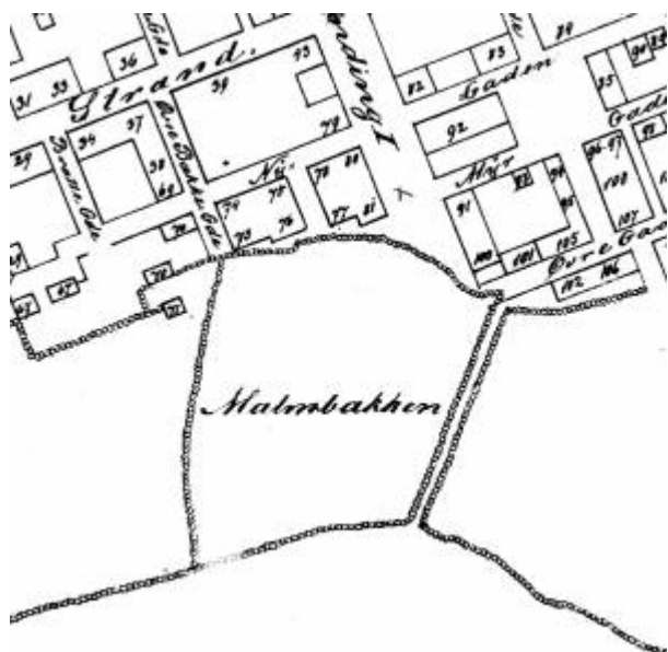
Utsnitt av Bykart 1868

Malmbakken var et jordstykke under Årstad som lå omtrent der Malmgaten nå ligger - beliggenheten er bl.a. vist på Reguleringsplan 1858 . Betegnelsen kommer muligens av at en familie som het Malmø eide stykket, men det kan også bety at det var en sandbakke her (malm kan bl.a. bety sand). 1)