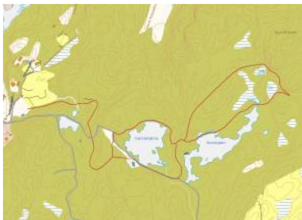
Den opprinnelige lysløypetraseen. Kart: Eigersund kommunes kartløsning

I 1992 ble lysløypa i Vannbassengan tatt i bruk. Den var opparbeidet i en trase som Eigersund Skog- og Treplantningsselskap og kommunen hadde forhandlet seg fram til. Den gikk hovedsakelig på eksisterende veger i området, men en del av traseen måtte bygges i uberørte områder. Samlet lengde på den opprinnelige lysløypa var 2,8 km. 1)