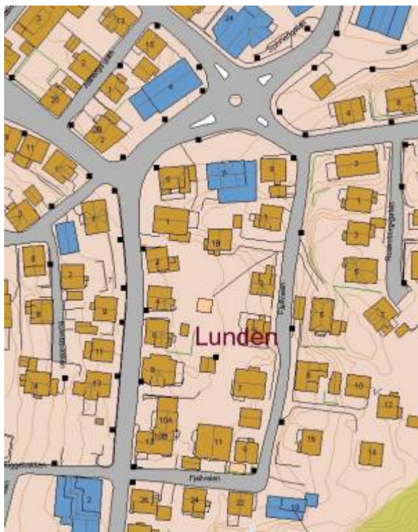
Kart: Eigersund kommunes kartløsning

Lunden kalles det området som Fjellveien i dag går gjennom. Tidligere var det nok navn på et større område som strakte seg fra begynnelsen av Heggdalsveien, langs forsiden av Årstadfjellet og et stykke opp i Sandbakken .