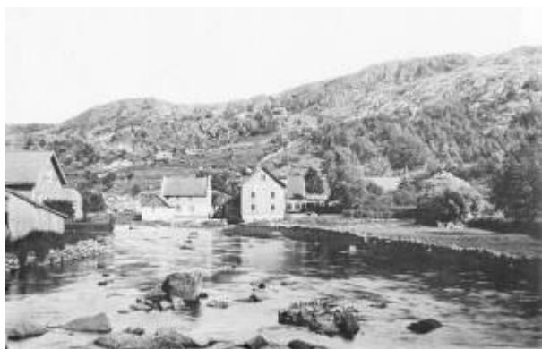
Nedre del av Lundeåne med Aabergs mølle i bakgrunnen.

Lundeåne (off.: Lundeåna ) utgjør sammen med Eieåne den nedre del av Hellelandsvassdraget, et vassdrag som har et nedslagsfelt på 243,3 km 3 og en høydeforskjell på 0 til 906 m.o.h. Åne (elva) har sannsynligvis navnet sitt etter stedsnavnet Lunden . Lengden er rundt 1,2 km.