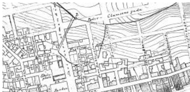
Utsnitt av Reguleringsplan 1905