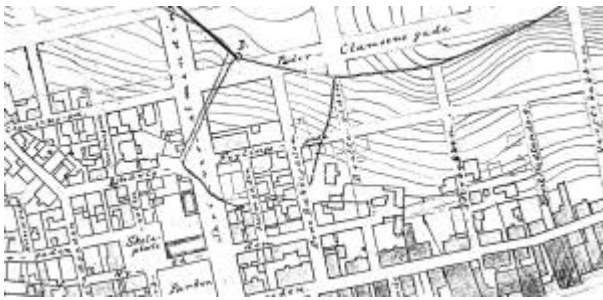
Utsnitt av Reguleringsplan 1905