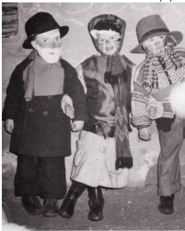
Lossi, ca. 1970.

Å gå lossi vil i dag si å kle seg ut og dra fra dør til dør, syngje julesanger og få godteri som belønning.