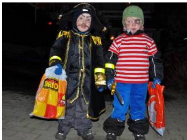
Lossi i 2008.