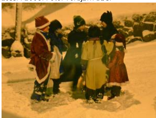
I året 2012 virket det som det var mer populært enn noensinne å gå lossi.