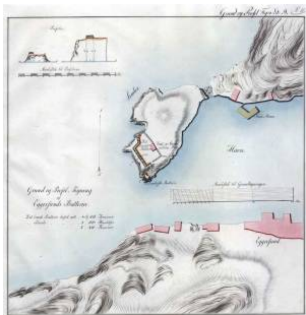
Kart over Lindøy batteri med omgivelser.