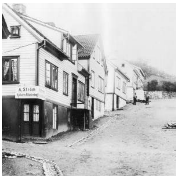
Lerviksbakken i 1890-åra.

Reguleringskomisjonens forslag til gatenavn var Lervigsalmenningen , men i bystyret ble det vedtatt Lerviksbakken for den øvre delen (sør for Storgaten ) og Nytorvet for den nedre delen (nord for Storgaten ).