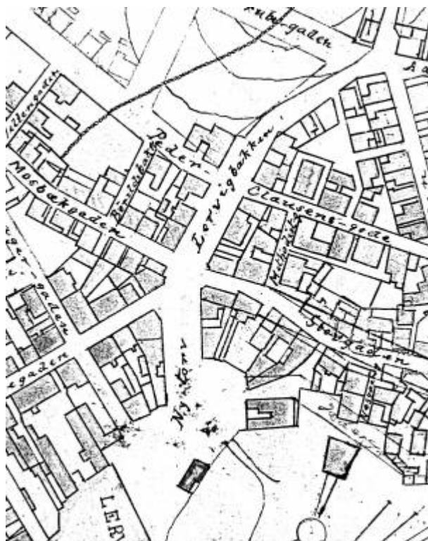
Utsnitt av Reguleringsplan 1905

Gate mellom Nytorget og Årstadgaten , navnsatt i 1905. Navnet kommer fra vika som før lå i bunnen av bakken, Lervika , men som ble fylt igjen på begynnelsen av 1890-tallet og videre utover første halvdel av 1900-tallet.